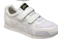
0101 ホワイト×ホワイト