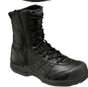
9090 ブラック×ブラック