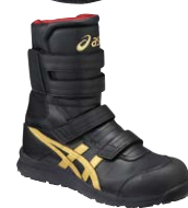
9094 ブラック×ゴールド