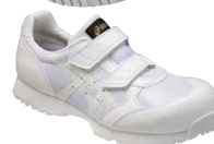
0101 ホワイト×ホワイト