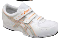
0193 ホワイト×シルバー