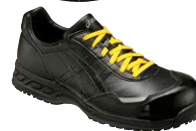
9090 ブラック×ブラック